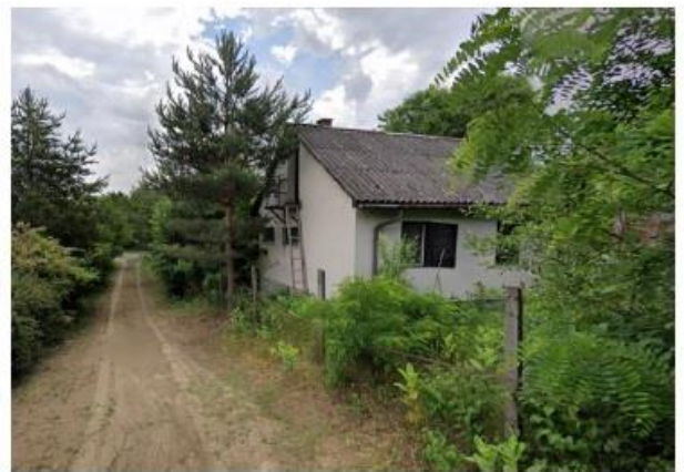
saját használatú út