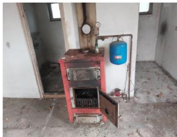
vegyes tüzelésű kazán